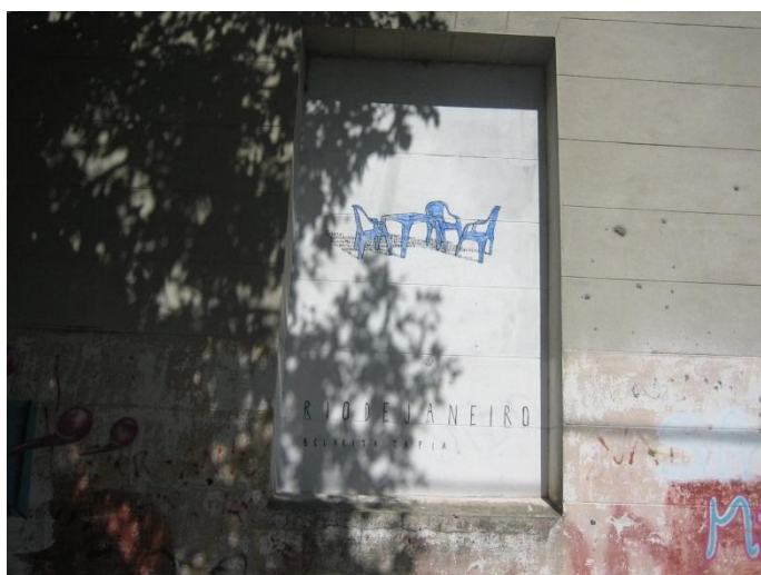
23 (65 y 66) La Plata. "riodejaneiro" pared trasera edificio

pensando su trabajo. "los trabajos suelen ser mucho m s que los dibujos, que suele ser una muestra y suelen ser muy  ntimos. En el momento que voy dibujando voy pensando c mo va a seguir esto y se va armando. Trato de elegir el recurso en funci n de lo que quiero decir". Opt  por encuadrar sus trabajos dentro del formato rectangular y vertical de las ventanas seleccionadas como soporte de sus pinturas. Son todos muy similares en tama o y formato. Se