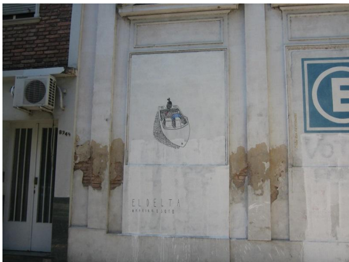
63 n  874 y 1/2 La Plata. "eldelta" Muro exterior cochera

Los trabajos que componen la serie "Paseo de verano" fueron concebidos como obras efímeras, dibujos pintados con t mpera sin ninguna protecci n, es decir que la b squeda de priorizar la idea y el proceso sobre la permanencia de la obra estaba presente. "La idea en realidad era que paseo de verano fuera de verano nada m s. Compr  t mperas porque quer 